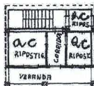
PIANTA PIANO ATTICO